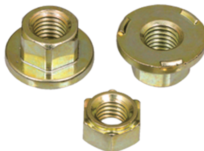
四角与六角焊接螺帽 Square & Hex Weld Nut