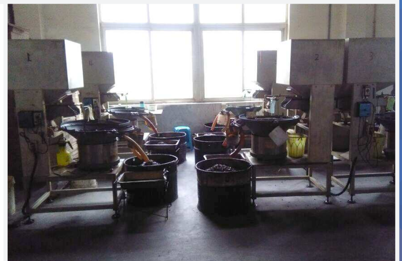
包装部 Packing Department