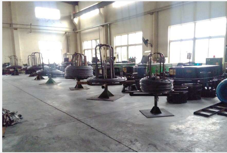
成型部 Forming Department