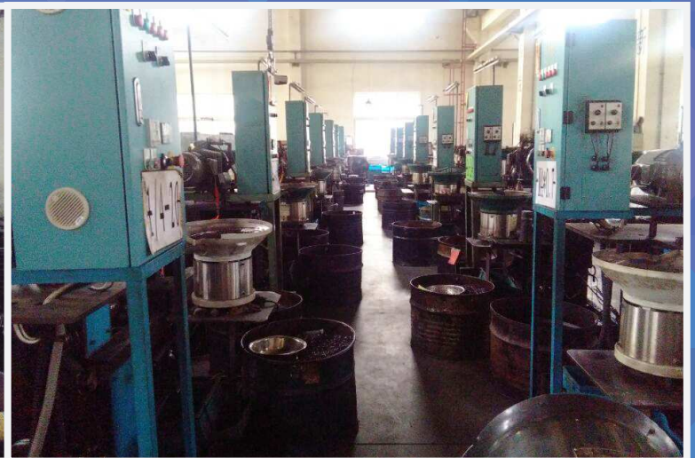
组装部 Assembling Department