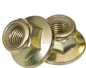
尼龙六角轮缘螺帽 Nylon Hex Flange Nut