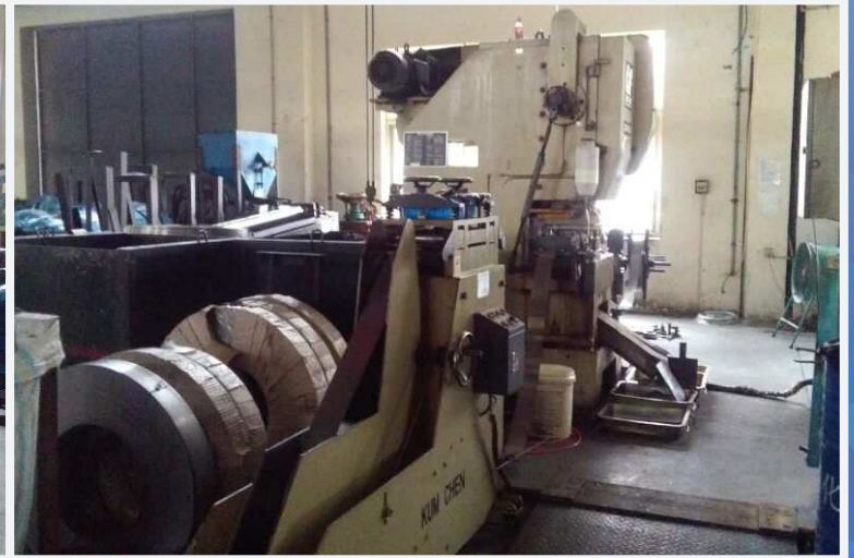
冲床部 Stamping Department