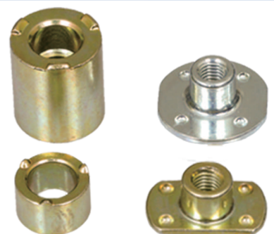
圆形&T型焊接螺帽 Round & T Weld Nut