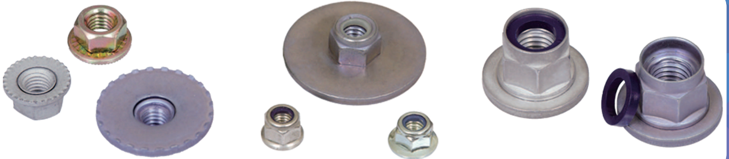
花齿盘帽 Serration Conical Washer Nut