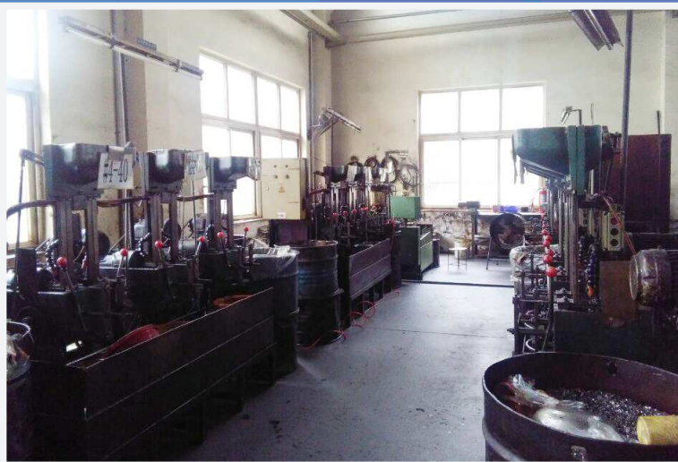
攻牙部 Tapping Department